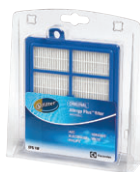
EFS1W s-filter® Abluftfilter