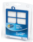
EFH12W s-filter® Abluftfilter