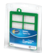
EFH12 s-filter® Abluftfilter